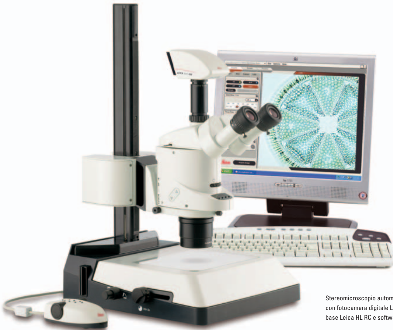
Stereomicroscopio automatizzato Leica MZ16 A con fotocamera digitale Leica DFC490, base Leica HL RC e software Leica LAS