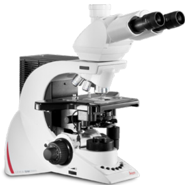
Microscópio DM3000 – Configuração profissional

O Conjunto de Soluções para Patologia oferece três soluções completas de fluxo de trabalho para ajudá-lo a trabalhar confortavelmente e garantir diagnósticos rápidos e eficientes.