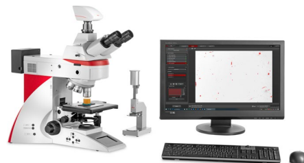
Microscópio vertical DM4 M - Configuração avançada

Todas as configurações da solução para qualidade do aço estão disponíveis com microscópios verticais, assim como invertidos.