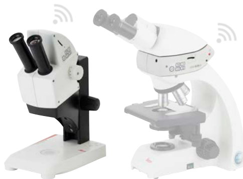
Leica EZ4 W

Le nouveau stéréomicroscope Leica EZ4 W avec caméra numérique Wi-Fi intégrée et la caméra Wi-Fi Leica ICC50 W pour microscope droit.