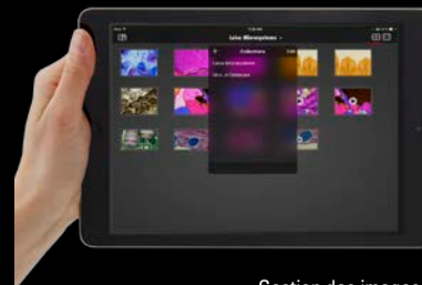
Gestion des images