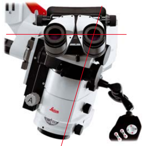
Leica M520 con Leica DI C500 o Leica Ultra Observer, posición horizontal ergonómica del tubo a pesar de la posición inclinada del cabezal óptico