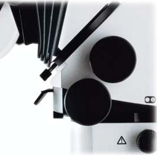
Detalle importante de Leica ULT 500: Palanca de conmutación para la salida del ayudante: lateral o trasera