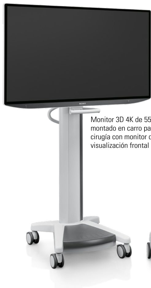
Monitor 3D 4K de 55" montado en carro para cirugía con monitor de visualización frontal