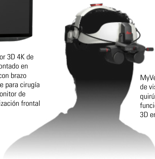
MyVeO, casco de visualización quirúrgica multi-función para cirugía 3D en vivo

Cualquier descripción de EnFocus mencionada en este documento se refiere al dispositivo médico EnFocus 2300 Integrated OCT System.