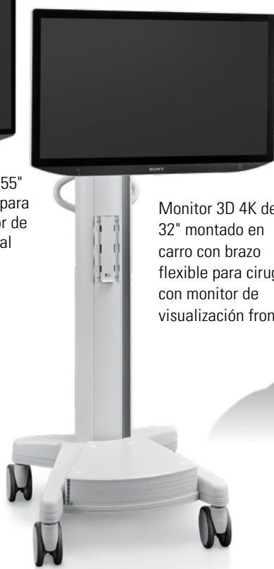
Monitor 3D 4K de 32" montado en carro con brazo flexible para cirugía con monitor de visualización frontal