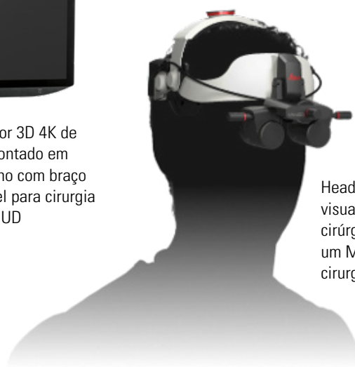
Headset de visualização cirúrgica tudo-em-um MyVeO para cirurgia 3D ao vivo

Qualquer descrição da EnFocus mencionada neste documento refere-se ao dispositivo médico EnFocus 2300 Integrated OCT System