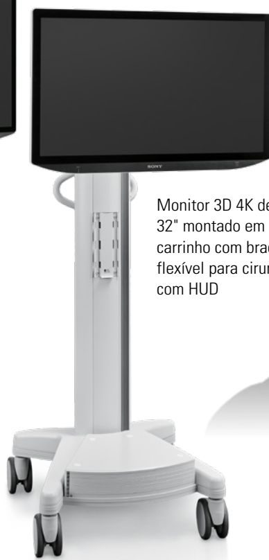
Monitor 3D 4K de 32" montado em carrinho com braço flexível para cirurgia com HUD