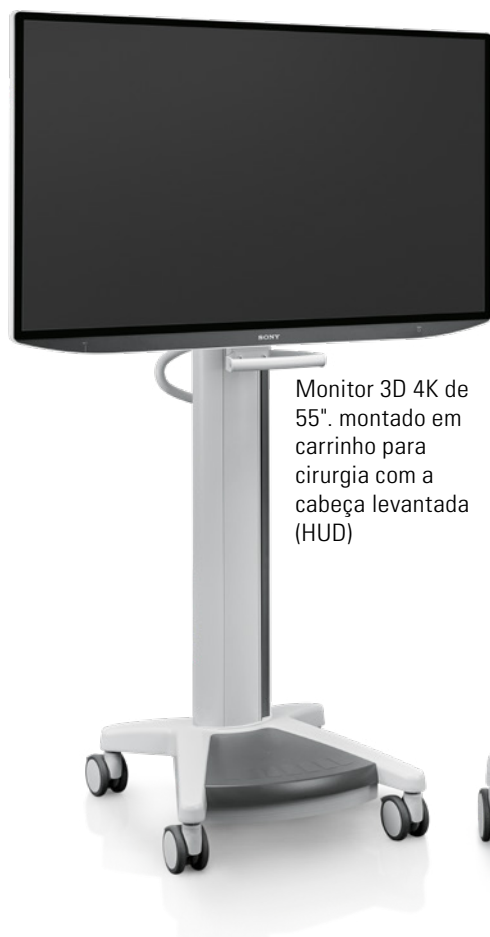
Monitor 3D 4K de 55" montado em carrinho para cirurgia com a cabeça levantada (HUD)